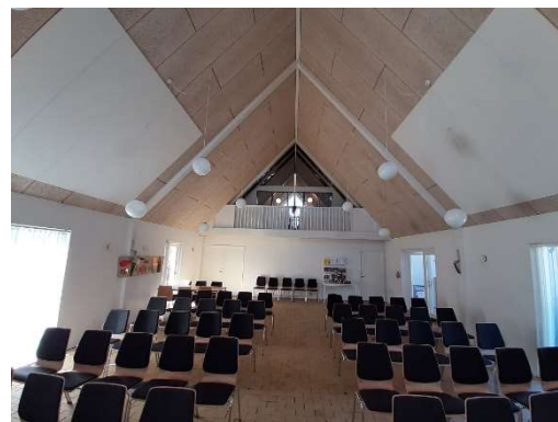
Gratiakirken i Skejby, Aarhus

Gudstjeneste, undervisning, andagter, sang. Dåb og nadver. Skriftemål med syndsbevidsthed og tilgivelse. Hvorfor har vi disse aktiviteter? Fordi Jesus Kristus har lovet at være hos os og tage bolig i vore hjerter ved troen, når vi hører Ordet og får tilgivelse i Sakramenterne. Gud kommer simpelt hen til os i sin nåde. Derfor. Og fordi han siger, at vi skal. Det 3. bud om at holde hviledagen hellig udtrykkes sådan i Nye Testamente: Lad Kristi ord bo i rigt mål hos jer. Undervis og forman med al visdom hinanden. Gør det med salmer, hymner og åndelige sange. Syng med tak i jeres hjerte til Gud. Hvad I end gør i ord eller gerning, gør det alt sammen i Herren Jesu navn, og sig Gud Fader tak ved ham! (Kol 3,16-17).