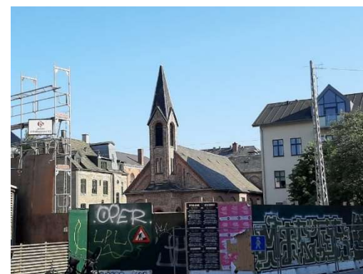
Martinskirken, Martinsvej på Frederiksberg