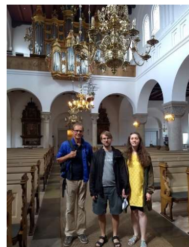
Forberedelse til bryllup i Vor Frue Kirke i Aalborg: Organist og brudepar