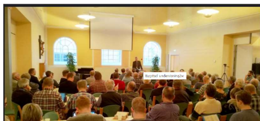
Luthersk Forbybningsdag om dåben i Herning 30.11.2019