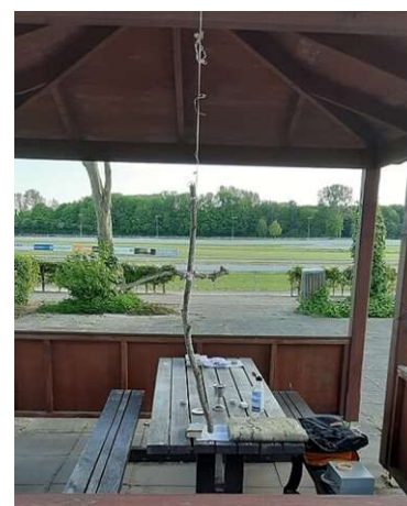
Gudstjenester på Odense Væddeløbsbane foråret 2020