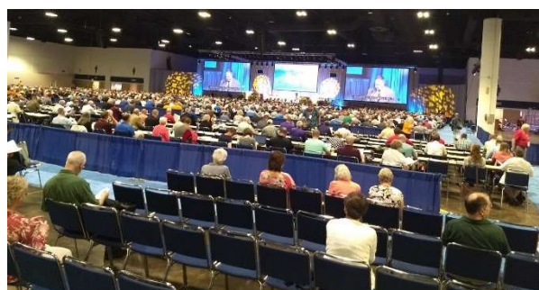
Synodemøde (convention) i Den Lutherske Kirke – Missourisynden (LCMS) i Tampa, Florida, 20.-25. juli 2019