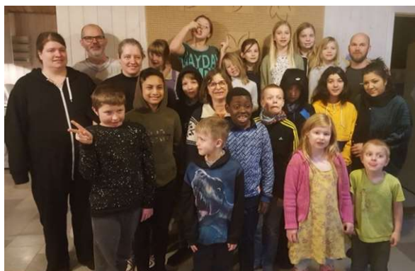
Vinterlejren 7.-9. februar 2020

I bærer med økonomiske gaver og forbøn. Og fylder kirkerne om søndagen. Hjælp os med også at holde fast ved oplæringen – både for børnene – og for jer selv. Først og fremmest derhjemme. Men også i den fælles undervisning og i gudstjenesten i menighederne. Travlhed og prioriteter gør det vanskeligt at få tid. Overvej og hjælp hinanden til andagt derhjemme og i menigheden.